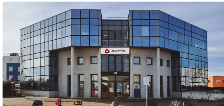
Notre siège social à Chassieu